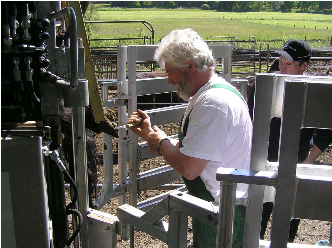
aber auch die Teilnehmer waren gefragt und mussten ran an die Klaue!!!

Nach durchgeführter Behandlung konnten alle Tiere vergnügt und munter ins Grüne spazieren. Jeder war begeistert und konnte neue Erkenntnisse mit nach Hause nehmen.