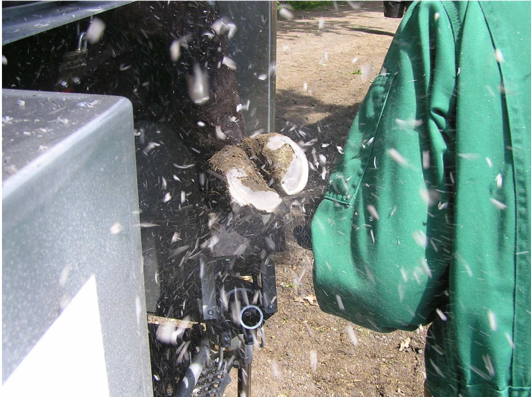
... und schon fliegen die Spähne...